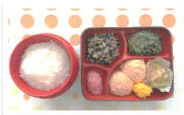
●主食:粥 副食:小刻み