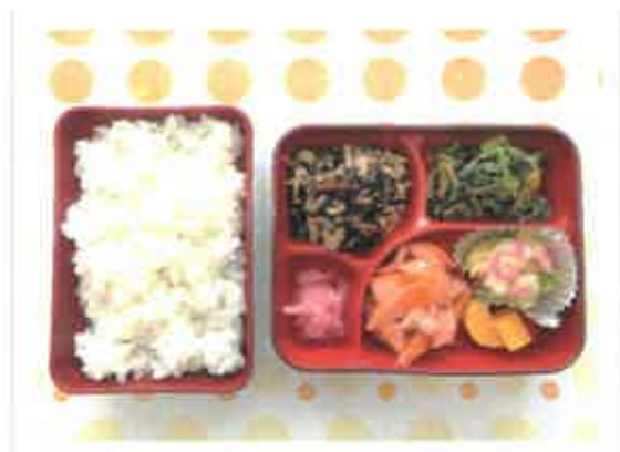
●主食:ごはん 副食:刻み