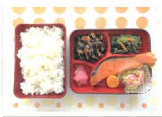
●主食:ごはん 副食:普通