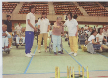
輪投げ大会にて…上位を目指せ!!