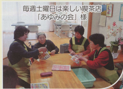
毎週土曜日は楽しい喫茶店 「あゆみの会」様