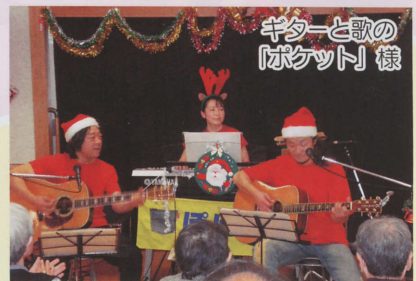
ギターと歌の 「ポケット」様