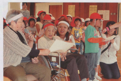
運動会にて…園児のみんなと力を合わせました