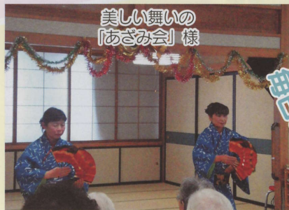
美しい舞いの 「あざみ会」様