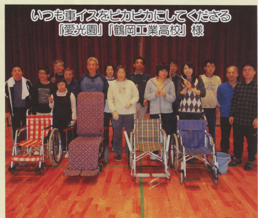
いつも車イスをピカピカにしてくださる 「愛光園」「鶴岡工業高校」様