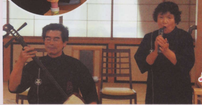
心に響く演奏の 「糸織楽」様 いとくら