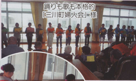
踊りも歌も本格的 「三川町婦人会」様