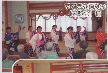
すてきな踊りの 「若駒会」様