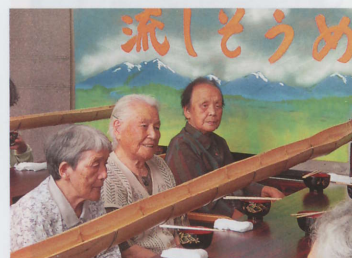
流しそうめんにて… 待つ事も楽しみです。