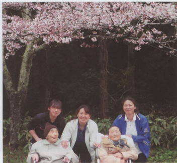
大山公園に花見に出かけました。

お菓子作り、郷土料理作り、レクリエーション等、ご利用者の希望をとり入れた余暇活動をしています。