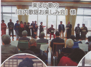
楽しい歌の 「庄内歌謡お楽しみ会」様