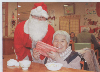
サンタクロースからのプレゼント 今年は何かな？