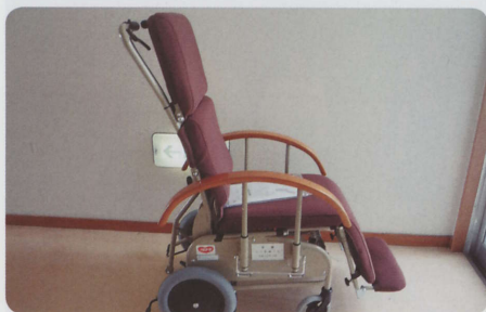
三川町婦人会の皆様から金銭のご寄付を頂き、車椅子を購入しました。