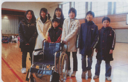
押切小学校児童の皆様から車椅子を頂きました。