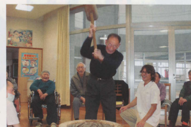
みんなで掛け声「よいしょ!!」