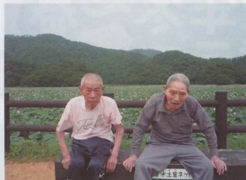
バスハイクにて…次はどさ？いぐ？ (昨年8月は大山・上池の蓮の花を見に行きました。)