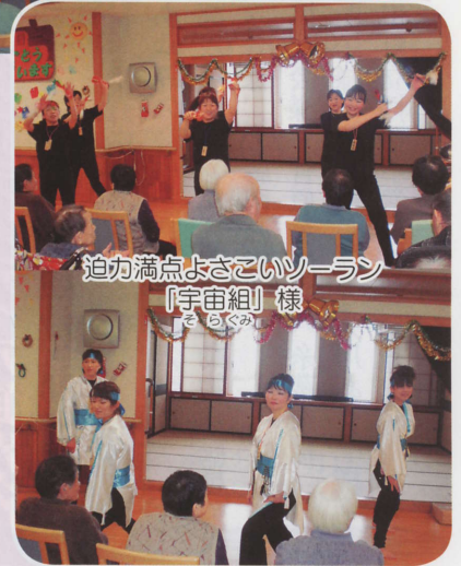
迫力満点よさこいソーラン 「宇宙組」様 （もぐり組）