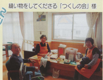
縫い物をしてくださる「つくしの会」様

限られた紙面の中で、 全てのボランティアさん を載せることができ ず、申し訳ありません でした。 なの花莊を支えてくだ さりありがとうございます。