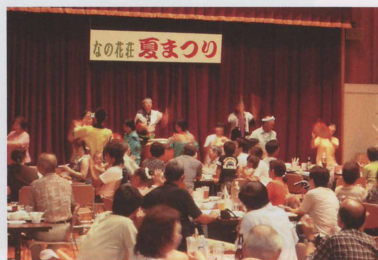
夏祭りにて…ご家族の皆さんもご満悦