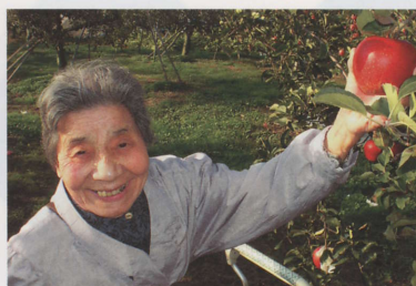
りんご狩りにて… もぎたては格別なのです。