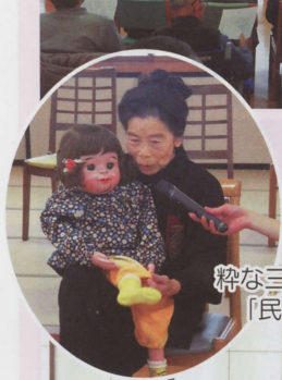
粋な三味線と腹話術の 「民謡睦実会」様