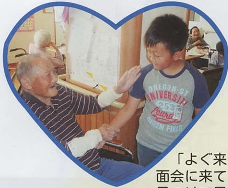
「よく来たの～」 面会に来てくれるひ孫さんを見つけて思わず握手