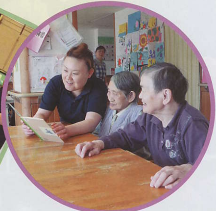
午後のひととき この日は昔話を一緒に 朗読しながら楽しみました