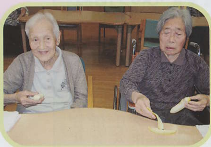
① みんなでバナナの 皮をむきます