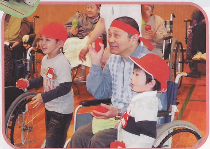
三川幼稚園のぞう組さんと運動会 玉入れ何個入るかな?