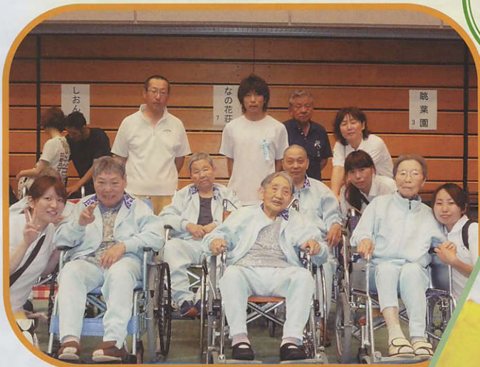
輪投げ大会に今年も出場しました お揃いのジャージで大健闘!!