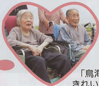
「鳥海山 きれいだごと～」