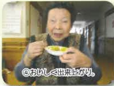
④おいしく出来上がり。