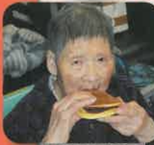
最後は皆さまの胃袋の中へ