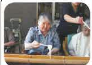
毎年恒例の名物の「流しそう めん」です。テラスで行いま す。