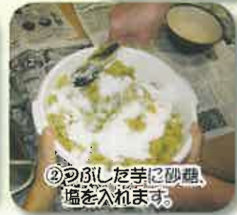
②つぶした芋に砂糖、塩を入れます。