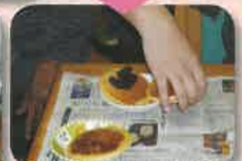
②焼けたホットケーキにあんこをはさみます。