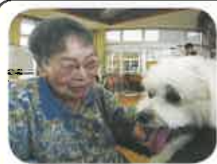
「ワンちゃんふれあい Day」 年8回ボランティアさんの協 力を得て、動物たちとのふれ あいを持って頂いています。