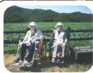
「ドライブ」 昨年は、大山上池で蓮の花を 観賞しました。天候にも恵まれ、 蓮の花の前で、はいっパチリ!