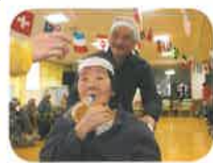
デイサービスフロアにて行い ます。赤組・白組に分かれて、 応援にも熱が入ります!一週 間を通して行っています。