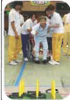
「山形県老人ホーム輪投げ大会」 えりすぐりのメンバーで、今年 は優勝目指して頑張るぞ!