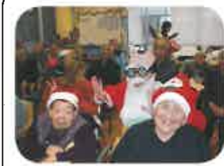
ボランティアの方による唄や 踊り、職員の出し物で大いに 盛り上がります。