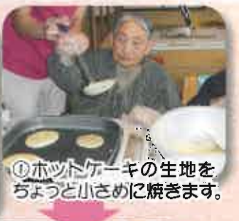
①ホットケーキの生地をちよつと小さめに焼きます。