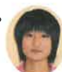
介護員 舞 ①鶴岡市藤島 ②継続は力なり

と思ひますが、常に努力し学ぶ心を忘れず謙虚な気持ちを持ち続け、自分なりに一生懸命頑張りたいと思ひます。よろしくお願ひします。