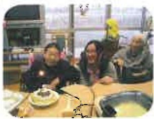
皆で作りました。クリスマス は、やっぱりケーキ。