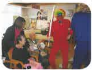
回を払って、福よ来い。