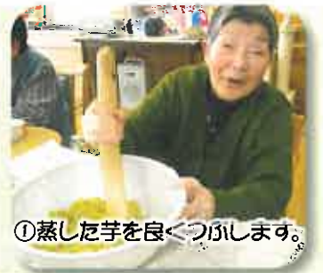
①蒸した芋を良くつぶします。