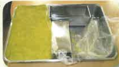
③流し箱に入れ、1日待ちます。