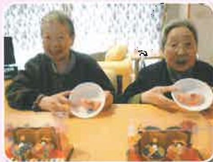
上手にできてニッコリ笑顔

三月三日。なごみ、ゆかり、それぞれグループで桃の節句のお祝いをしました。桜餅を生地から作り、あんこを挟み、とても美味しい桜餅が出来ました。皆でお雛様の歌を歌ったりとても楽しい会となりました。