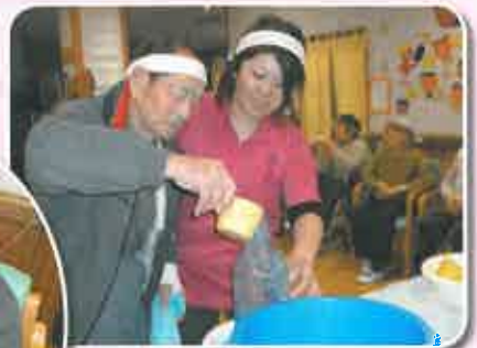
上手にツップで水も入れていきます。