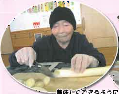
美味しくできるように丁寧に切っています。