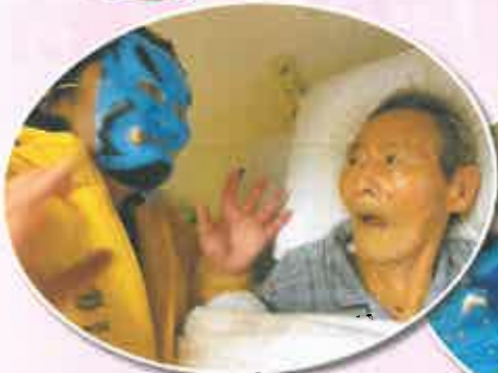
うわ～、たまげたこと！ お部屋にも鬼が訪問です