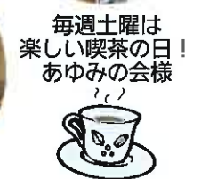
毎週土曜は楽しい喫茶の日! あゆみの会様