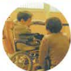
素敵な演奏とおどりの糸蔵楽様