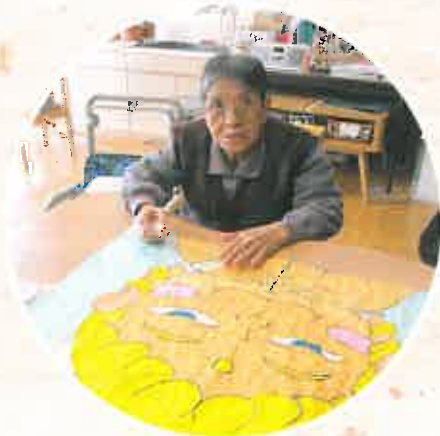
表紙の写真は、ショートステイご利用者の皆様が協力して作成したちぎり絵です。