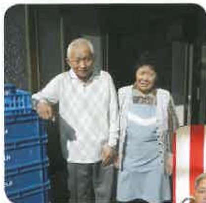
誕生日にご自宅へ行きました

「自宅にいきたい」「大好きな食べ物を食べたい」「買い物、ドライブに出かけたい」という、1人ひとり、様々な願いをできる限り叶えています。