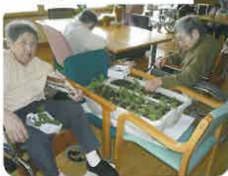
二十日大根の収穫をしているところです