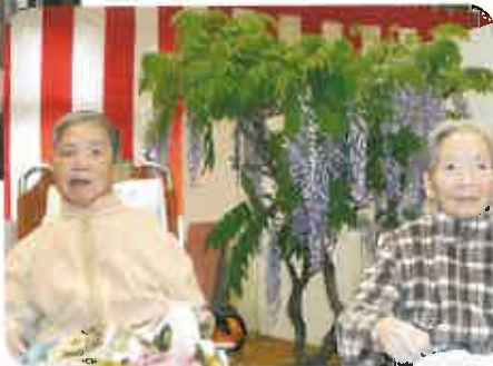
藤の花を見に行きました