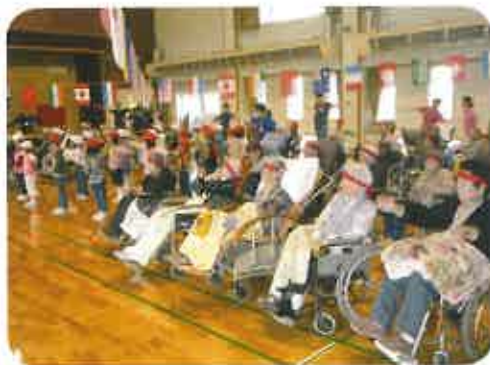
みんなで準備体操しています

毎年恒例のみかわ幼稚園、園児との運動会。今年は、ライオン組の子供達と楽しく運動会を行いました。かわいらしい子供たちの姿に癒されました。