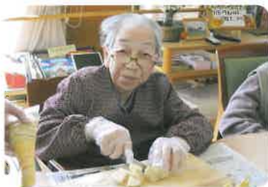
切る作業はお手のものです

りなどの出店で使われる本格的 なたこ焼き機を準備して、職員が 利用者の方の目の前で焼く姿は、 皆さんの視線を一身に浴び、皆 さん今か今かと出来上がりを楽し しみに待ちわびていました。 勿論、味の方も、大変おおいし いと大好評でした。 今後、ショートステイの行 事として、月二回のお菓子作り を予定しています。季節に合わ せて、利用者の方に喜んで頂け るように企画していきます。