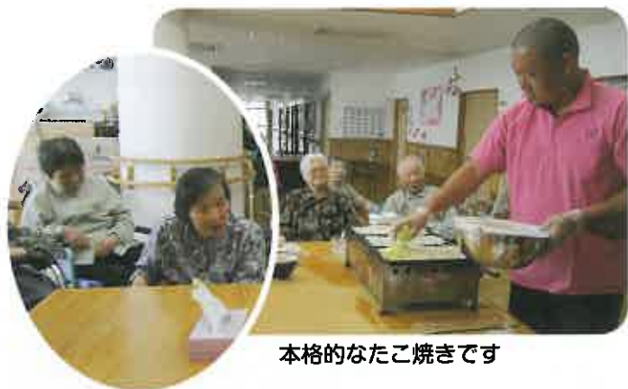
本格的なたこ焼きです

ショートステイでは、4月に お花見、5月・6月は孟宗汁作 りやおやつ作りをしました。 おやつ作りでは抹茶豆パンや あんパン、たこ焼き、あじさい 牛乳寒天等を作って舌鼓をうち ました。 中でも、とり分け好評だった のが、たこ焼き作りでした。お祭